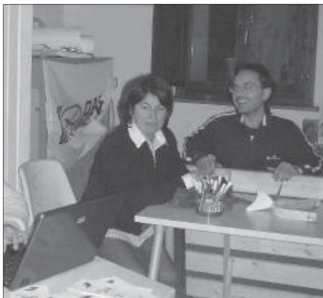
Apav L'associazione conta 140 soci tra famiglie, operatori del settore e insegnanti e oltre 20 volontari

Questo documento obbliga in modo chiaro l'applicazione di tutta una serie di strumenti per il diritto allo studio. In questo senso l'Apav rivendica il suo impegno per la diffusione di una nuova cultura dell'integrazione e una didattica innovativa, capace di rispondere alle esigenze di tutti gli studenti. Proprio questo è l'obiettivo principale dell'associazione Apav che ha promosso in questi anni l'utilizzo delle tecnologie informatiche per rispondere ai bisogni dei ragazzi con difficoltà di apprendimento. L'associazione ha cercato di far uscire il problema della dislessia dal ristretto ambito specialistico per farne un potente mezzo di cambiamento culturale. L'ottica con cui l'Apav ha operato